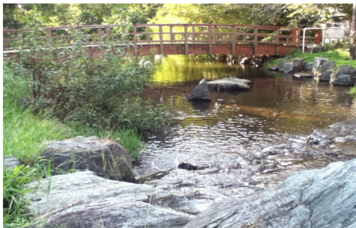
左：6頁掲載「あだち だより」の東綾瀬公園

発行者 小林 裕一 発行所 東京都行政書士会足立支部 住所 東京都足立区綾瀬2-24-8-205 TEL 03-5680-2781 FAX 03-5680-2782 編集人 佐田 祐介, 北 龍太郎