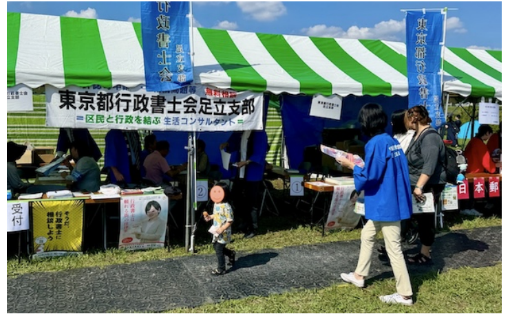
令和6年10月12日 あだち祭り「Aフェスタ」千住荒川河川敷 東京都行政書士会足立支部 「街頭無料相談会」